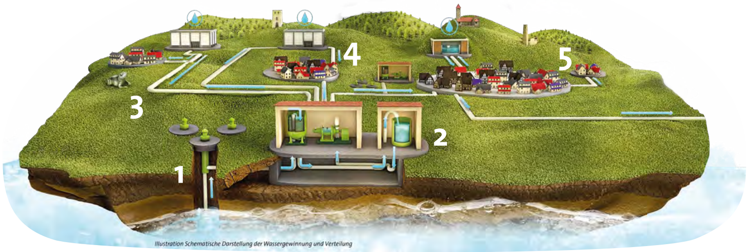
Illustration Schematische Darstellung der Wassergewinnung und Verteilung

Woinemer Klares durchläuft viele Stationen, bevor es lecker und rein bei Ihnen aus dem Hahn strömt. Die Stadtwerke Weinheim zeigen Ihnen, wie es funktioniert.