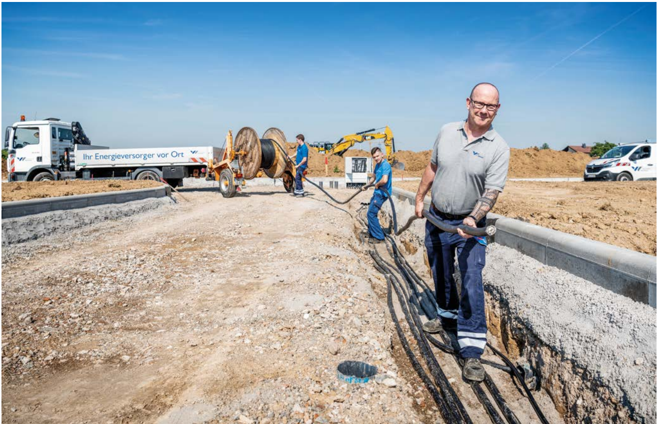
Das Team der Stadtwerke verlegt Stromleitungen im Neubaugebiet Allmendäcker.

Zugegeben, der Begriff Daseinsvorsorge klingt nicht besonders attraktiv, sondern sogar angestaubt und in die Jahre gekommen. Aber in Zeiten der Corona-Pandemie hat sich gezeigt, wie wichtig und aktuell die Grundversorgung mit Strom, Gas, Wasser und Wärme ist. Die Stadtwerke Weinheim haben trotz Krise die hohe Versorgungsqualität aufrechterhalten können.